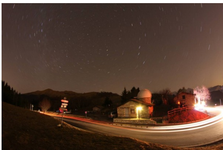
Figura 2: Rotazione polare. Singolo scatto effettuato dalla Colma di Sormano (CO) il 26/12/2011.

dall'inquinamento luminoso. Cercate di non sbiancare il fondo cielo del singolo scatto. Le immagini devono essere registrate in formato JPEG anche se come sempre è consigliabile riprendere in RAW e convertire i file successivamente. A questo punto impostate una serie di scatti tutti uguali intervallati dal minore tempo possibile. Nel caso di telecomandi questo potrebbe essere praticamente zero, mentre per lo scatto remoto da PC è di 5 secondi (tempo di scaricamento delle immagini). Ricordatevi che questo tempo deve essere molto minore del tempo di esposizione della singola posa. Il singolo scatto è riportato in figura 2 .