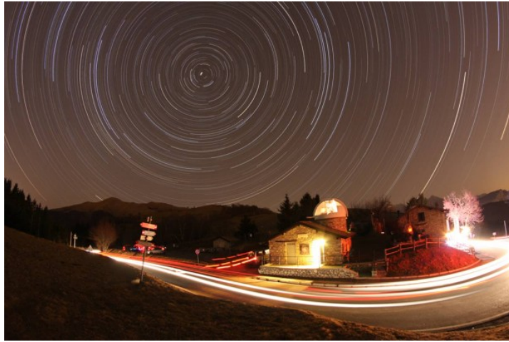
Figura 6: Rotazione polare. Somma di 20 scatti (tempo totale 3.40 ore) effettuata dalla Colma di Sormano (CO) il 26/12/2011. Applicata rimozione delle scie di tre aerei con Photoshop CS3.