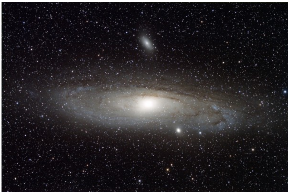
M31 (NGC 224) - 29/08/2011

Dati di ripresa: 30 pose da 6 minuti a 800 ISO (tot. 3.0h) + 10 dark + 56 bias + 57 flat (Geoptik flat generator, effettuati il giorno dopo). Elaborazione IRIS + Nebulosity 2.4 + Photoshop CS2/CS4 ( Clicca qui per l'immagine originale in formato JPG )