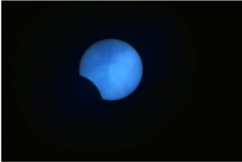
Eclissi Totale di Sole - 11/08/1999