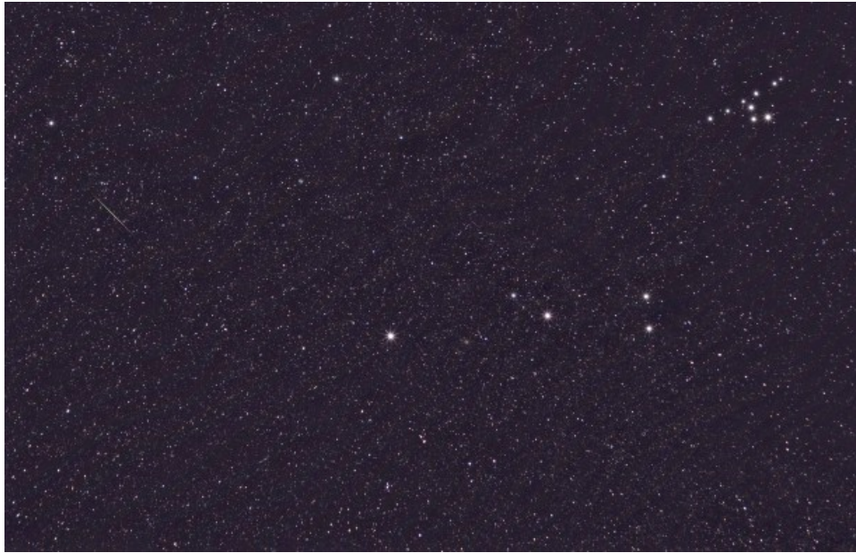
Nova Del 2013 - 15/08/2013

La stessa immagine con i riferimenti / The same picture with labels.: