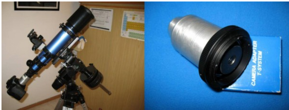
Figura 4.3: setup in configurazione “astrofotografia a fuoco indiretto”.

sviluppate tecniche digitali alternative in grado di ottenere risultati di gran lunga superiori a quelli ottenibili con la tecnica del fuoco indiretto. Malgrado ciò, questa tecnica è ancor oggi utile per la ripresa di satelliti naturali poco luminosi come le lune di Urano e Nettuno nonché sistemi stellari multipli.