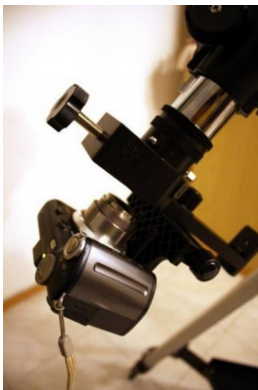
Figura 4.1: setup in configurazione "astrofotografia afocale".

gli effetti a mano libera, funziona in maniera egregia solo con la Luna ed il Sole, ovvero oggetti molto luminosi. Se si vogliono riprendere oggetti del profondo cielo allora è necessario utilizzare appositi supporti in grado di vincolare la reflex all'oculare. Con il metodo afocale si ottengono buoni risultati in termini di ingrandimento anche se la qualità ottica lascia molto a desiderare dato che dipende dall'oculare utilizzato, spesso soggetto ad aberrazioni di vario genere, oltre che ad una pesante vignettatura, e dall'obiettivo installato sulla fotocamera. Un vantaggio è la possibilità di effettuare riprese del profondo cielo anche con fotocamere dotate di posa M ma non necessariamente reflex, dato che l'obiettivo non deve essere rimosso.