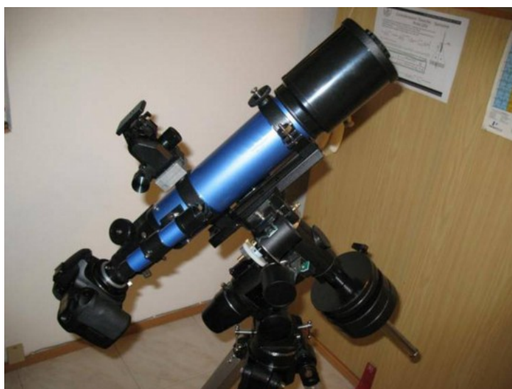
Figura 4.2: setup in configurazione "astrofotografia a fuoco diretto".

fotografico. Questo può essere realizzato grazie a specifici anelli adattatori, detti anelli T, che permettono di fissare la reflex al telescopio attraverso l'alloggiamento porta oculari. Un telescopio di focale e rapporto focale sarà quindi equivalente ad un obiettivo a focale e diaframma fissi. Nel caso della ripresa a fuoco diretto con telescopi non catadiottrici, l'utilizzo di spianatori di campo e correttori di coma è d'obbligo.