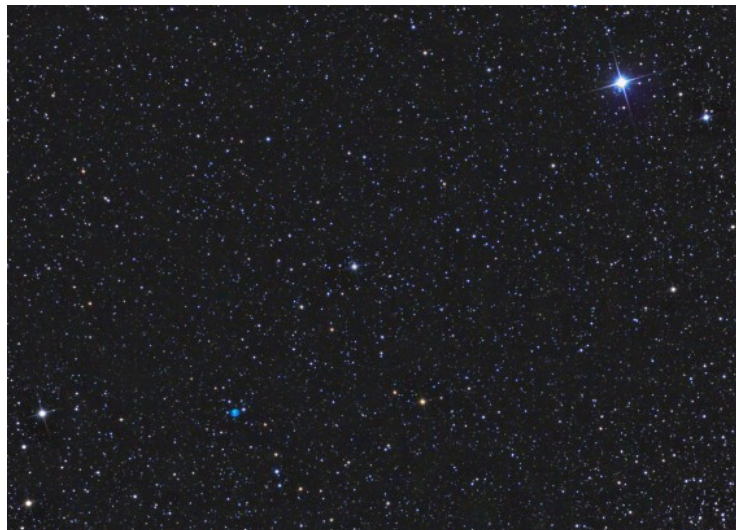
Figura 1.11: la Nova Delphini 2013 e la piccola nebulosa planetaria NGC6905.

Altri esempi sono le novae, ovvero stelle che per un certo periodo della loro vita vanno incontro a fenomeni esplosivi violenti in grado di aumentarne la luminosità. L’ultima nova visibile ad occhio nudo è stata la Nova Delphini 2013 esplosa il 14 Agosto del 2013 nella costellazione del Delfino (vedi Figura 1.11).