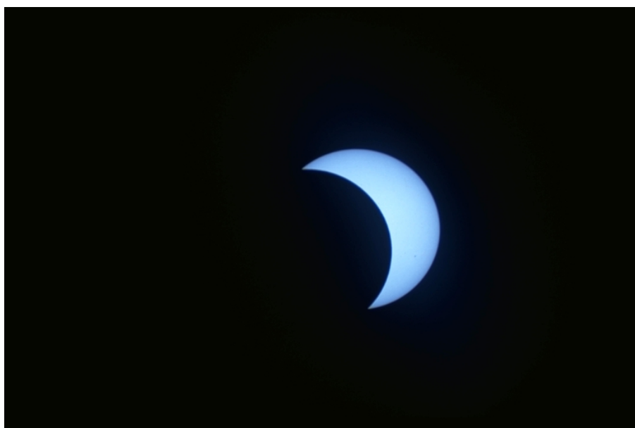
Figura 3: l'eclisse totale di Sole dell'11 agosto 1999.

riguarda Milano, l'eclisse inizierà il giorno 20 marzo 2015 alle ore 9:24 e terminerà alle 11:44 . Durante questo lungo periodo di tempo, la Luna occulterà pian piano il disco solare. Per chi non è interessato a seguire tutto il transito consigliamo l'osservazione del punto di massimo che sarà, sempre per Milano, alle ore 10:32 . Ovviamente i tempi di inizio, massimo e fine di un'eclisse dipendono dal luogo di osservazione. Riportiamo pertanto come altro estremo Siracusa, dove l'eclisse inizierà alle 9:23 e finirà alle 11:37 con il massimo previsto per le ore 10:28. Come si vede le variazioni non sono enormi per quel che riguarda il nostro paese. Se siete pignoli e volete i tempi esatti di ogni fase dell'eclisse, consigliamo l'utilizzo del software planetario Stellarium .