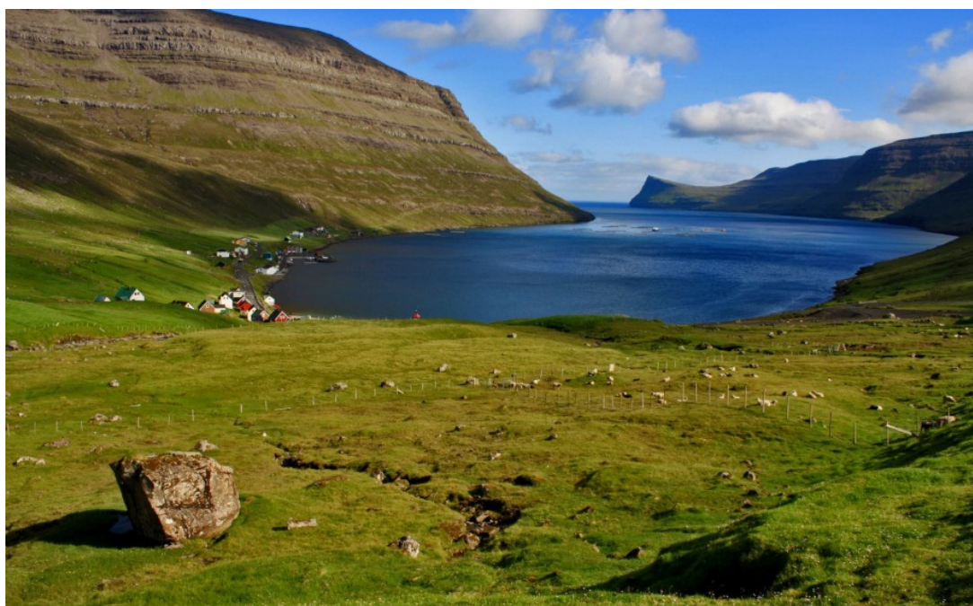
Figura 2: il fantastico paesaggio delle isole Farøe

Il 20 marzo 2015 , oltre ad essere il giorno di equinozio di primavera, il nostro pianeta sarà interessato da un'eclisse totale di Sole. Dato che l'ombra della Luna non coprirà tutta la Terra, solo una limitata regione vedrà occultare completamente il Sole. Nel caso del 20 marzo 2015, la regione di totalità attraverserà le isole Farøe (Danimarca) e Svalbard (Norvegia).