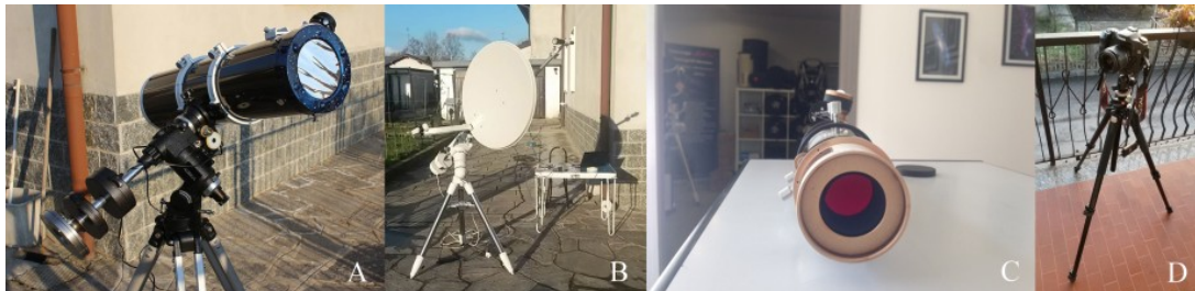
Figura 4: diversi strumenti per osservare l'eclisse parziale di Sole del 20 marzo 2015

ASTR0trezzi, attraverso la pagina Facebook dedicata, vi terrà aggiornati in diretta sulle varie fasi dell'eclisse ed eventuali riprese effettuate nell'ottico ed in banda radio (microonde). In questa pagina invece verranno pubblicate le immagini preliminari dell'evento. Seguiteci!