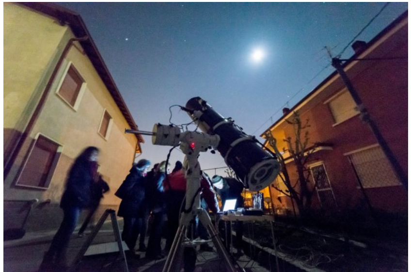
Figura 3: alcuni visitatori delle "Serate a Lo Smeraldino"

Seppure il punto di osservazione astronomica "Lo Smeraldino" nasce nel giugno del 2015, non potevamo non inserirlo nel resoconto annuale delle attività di ASTROtrezzi. Partendo dal voler dare un "nome" al punto da cui si vorrebbe fare della ricerca amatoriale con il nuovo telescopio Newton SkyWatcher 250 mm f/5 Black Diamond, ovvero il giardino di casa, oggi Lo Smeraldino è un punto di aggregazione per chiunque voglia avvicinarsi all'Astronomia da cieli "suburbani" come quelli della Brianza. Lo Smeraldino ha una sua struttura e permette, a chi vuole di sottoporre progetti di ricerca amatoriale. Inoltre, mensilmente, si organizzano serate di divulgazione pubblica che in un anno hanno già raccolto complessivamente qualcosa come 118 presenze vedi Figura 3). Ovviamente tutti gli eventi sono gratuiti, previa prenotazione.