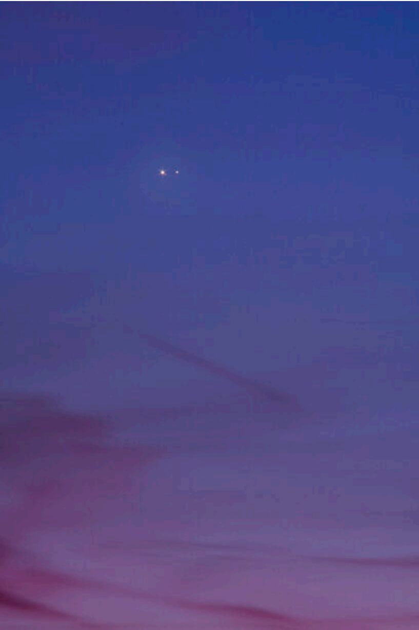
Congiunzione Giove e Saturno – 22/12/2020