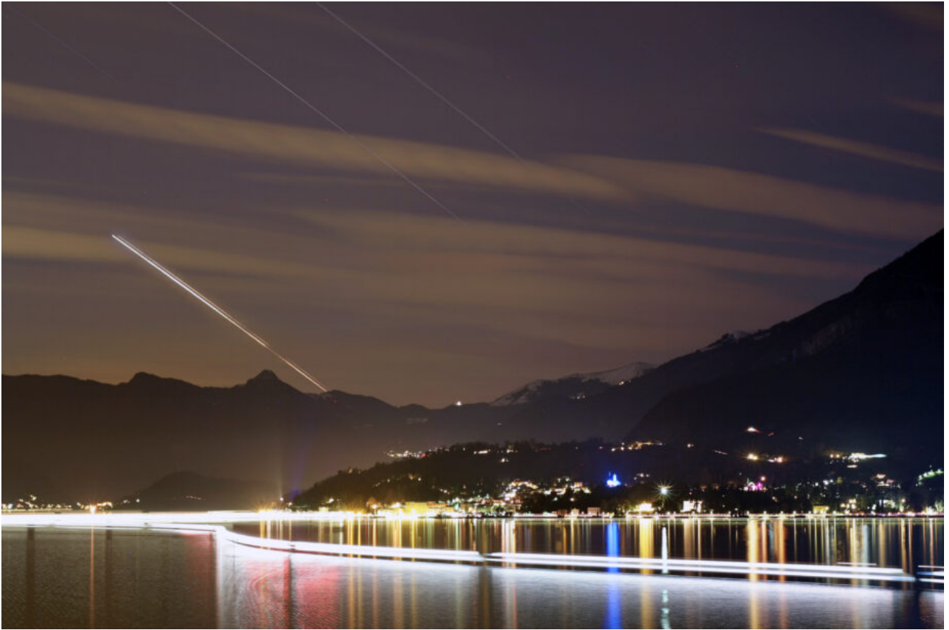
Star-trails congiunzione Giove e Saturno – 22/12/2020