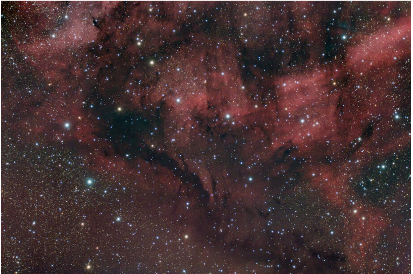
IC 5068 (telescopio/telescope #2) – 03/10/2022