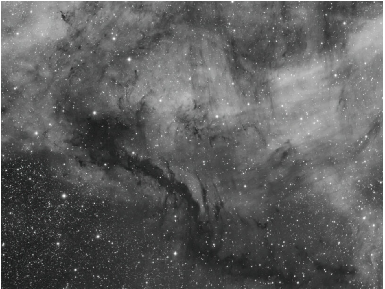
IC 5068 (telescopio/telescope #1) – 03/10/2022