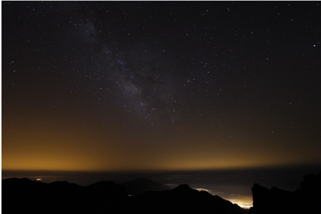
Figura 2: La Via Lattea di La Palma (Spagna), ripresa con una Canon EOS 7D e obiettivo zoom a focale 10 mm, f/3.5, 1600 ISO, 44 secondi.

Non siete ancora soddisfatti del vostro scatto? Non vi preoccupate, avrete modo di imparare le tecniche di elaborazione al computer nelle prossima lezione. Per il momento limitatevi ad inquadrare il vostro soggetto, mettere a fuoco (utilizzando la tecnica riportata nella lezione La nostra prima immagine notturna ) e scattare in modo da ottenere il maggior numero di stelle puntiformi (o quasi). Ovviamente scattate sempre in RAW al fine di ottenere il massimo dalle vostre foto.