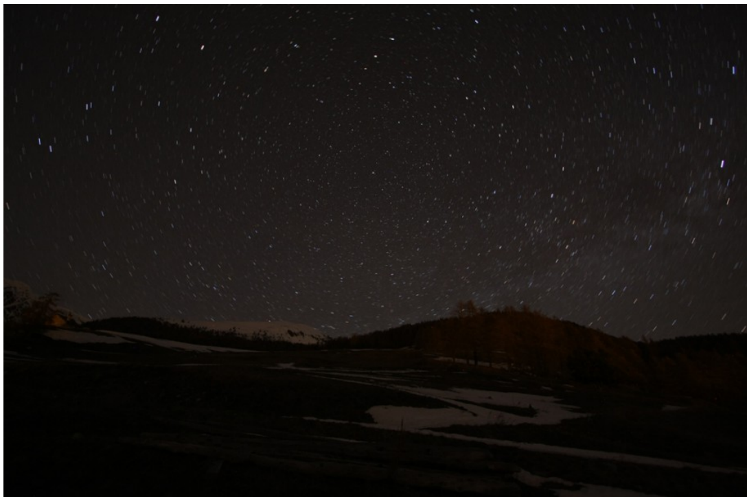
Figura 1: ecco cosa succede se aumentiamo di molto il tempo di esposizione: le stelle diventano star-trail.

Ormai siamo giunti all'ultima lezione tecnica dove tratteremo una delle tecniche più diffuse tra gli "astrofotografi newbie" e che quindi non poteva mancare in questo corso per principianti: gli star trail o rotazioni celesti. Tutte le stelle del cielo, a seguito della rotazione terrestre, sembrano ruotare intorno ad un unico punto fisso (Polo Celeste) che nel nostro emisfero coincide praticamente con la stella Polare. Nella lezione Fotografare pianeti, stelle e Via Lattea abbiamo imparato a scegliere il tempo di esposizione in modo che le stelle risultassero ferme. Cosa succede se ora aumentiamo il tempo di esposizione? Le stelle lasceranno una striscia (in inglese trail ) segnando con un archetto luminoso il lento scorrere del tempo. In figura 1 mostriamo un esempio di una posa da 240 secondi effettuata con uno zoom a 10 mm (f/3.5, 400 ISO).