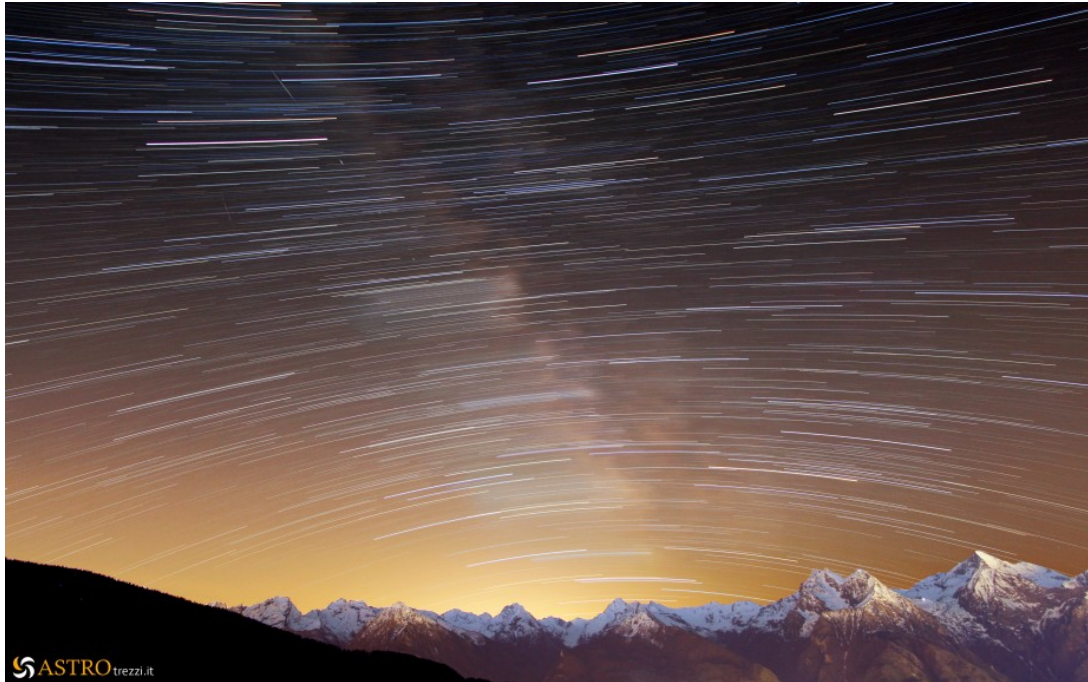
Figura 3: rotazione celeste in assenza di stella Polare.

Per l'ambientazione potete optare o per una silhouette utilizzando la tecnica imparata nella lezione La nostra prima immagine notturna , oppure per un paesaggio (paesi, oggetti, alberi, monti, ...). Ormai siete grandi e spetta a voi sfruttare la fantasia ☐