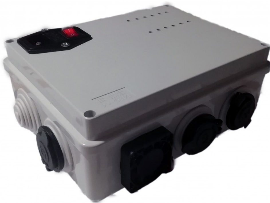
Figura 3: come appare l'alimentatore una volta assemblato e richiusa la scatola

Per quel che riguarda l'acquisto del materiale: la scatola, colla, capicorda, fusibili e nastro adesivo sono disponibili in qualsiasi negozio di bricolage (come ad esempio Brico io o Bricoman). La scatola costa sulle 18.00 €. L'alimentatore da 60W si trova su Amazon a 8.38 €. Sempre nel negozio on-line è possibile trovare le prese accendisigaro femmina impermeabile (5.50 €/l'uno), l'interruttore 220V con fusibile di sicurezza e luce di accensione (5.50 €) e la ventola a 12V (4.35 €). Il costo complessivo dell'alimentatore è pari quindi a circa 60 euro.