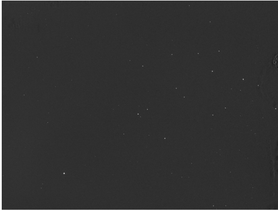
22 Kalliope - 25/08/2015

Note (note): Singolo frame ottenuto con PixInsight + Photoshop con indicata la posizione dell'asteroide. Video realizzato come sequenza di frame con PixInsight e Windows Movie Maker 2012. Infine riduzione effettuata con Astrometrica.