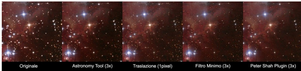
Fig. 3: Confronto tra l'applicazione dei quattro metodi illustrati in questo articolo per la riduzione dei diametri stellari.

quattro metodi di riduzione dei diametri stellari appena illustrati al fine di valutarne l'efficacia e la qualità. In Figura 3 è illustrato il risultato di questo test.