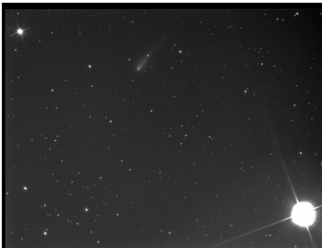
C/2012 S1 (ISON) - 17/10/2013

Note (note): Riportiamo l'immagine originale della cometa ed in colori invertiti. Dall'immagine è stato possibile ottenere una stima della dimensione della coda superiore a 395.47 pixel ovvero 19.45 arcmin (original and inverted pictures have been reported).