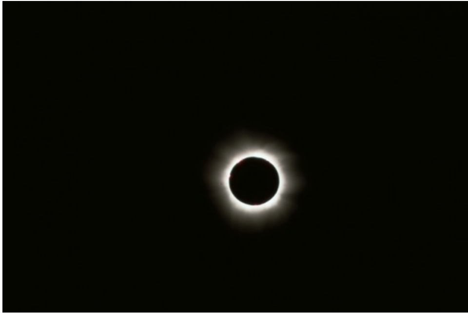
Eclissi Totale di Sole - 11/08/1999