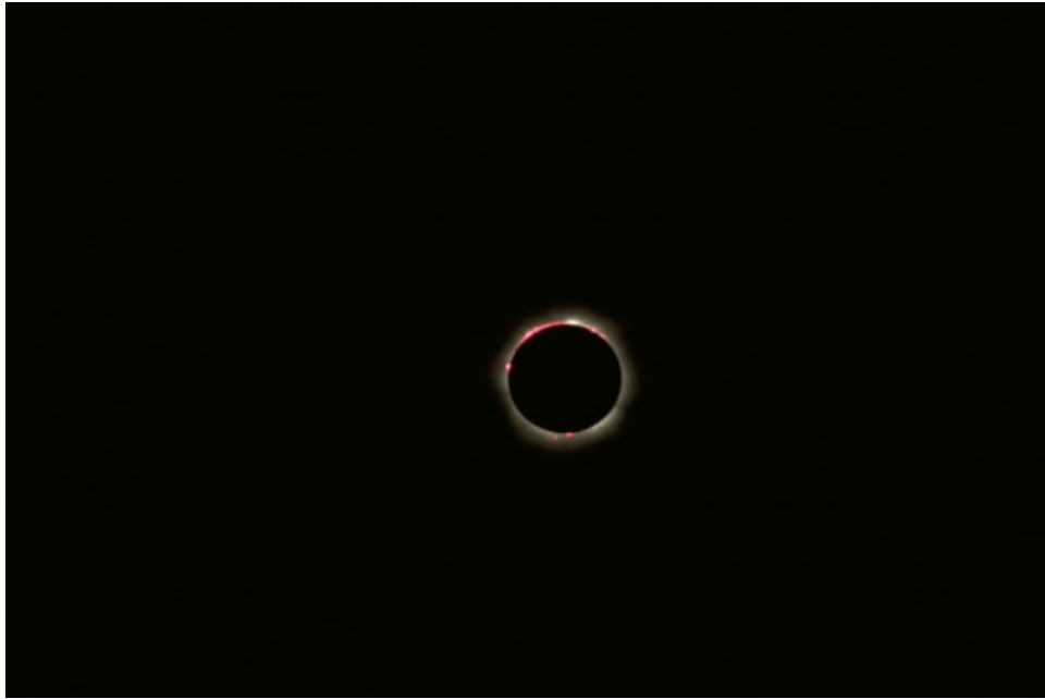
Eclissi Totale di Sole - 11/08/1999