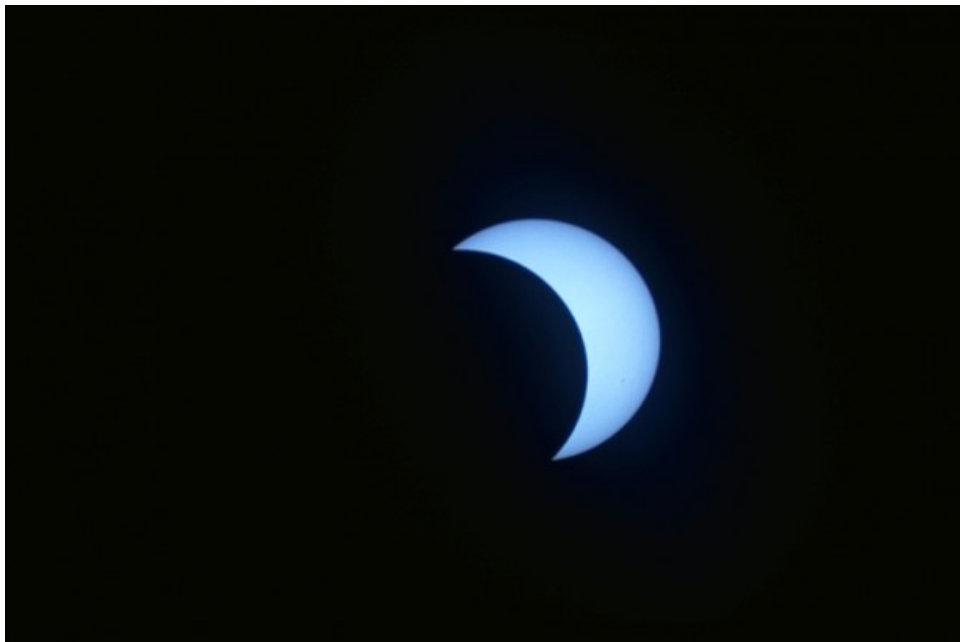
Eclissi Totale di Sole - 11/08/1999