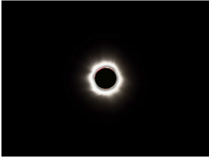
Eclissi Totale di Sole - 11/08/1999