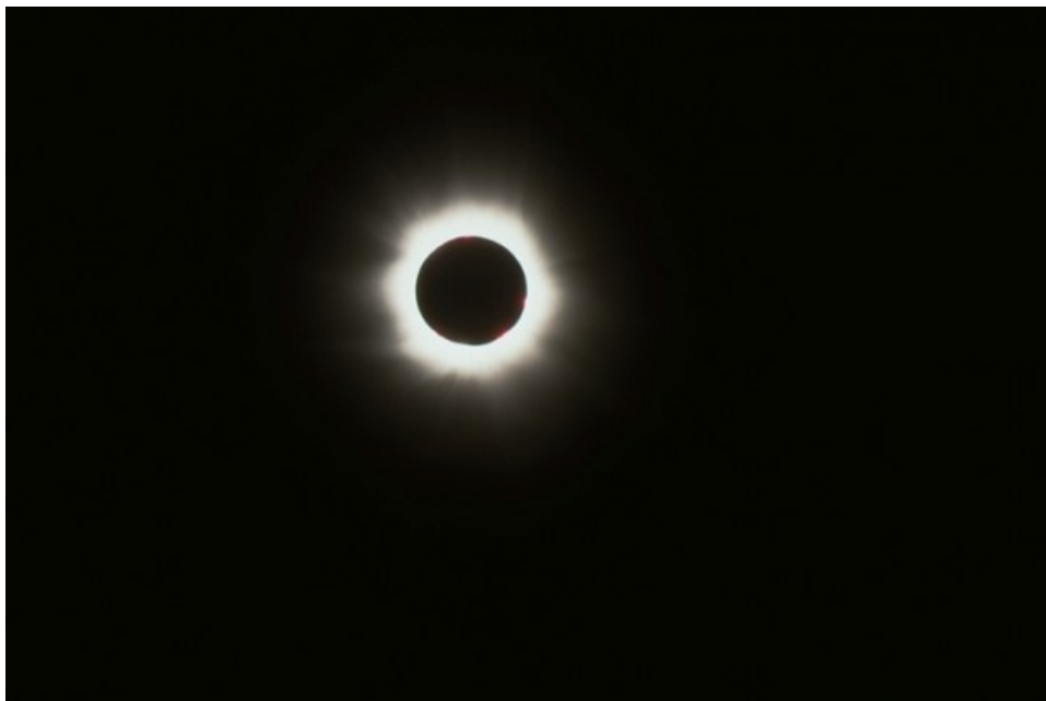
Eclissi Totale di Sole - 11/08/1999

Di seguito riportiamo alcune immagini riprese in occasione dell'eclissi totale di Sole. La camera è una Nikon FE2 + obiettivo Tamron 80-210 mm utilizzato a 210 mm + duplicatore di focale Tamron (focale equivalente 420 mm). Pellicola Kodakchrome. Le fasi parziali dell'eclissi sono state invece riprese sempre con la camera Nikon FE2 ma al fuoco diretto di un rifrattore acromatico Antares Venere 100 mm f/10.