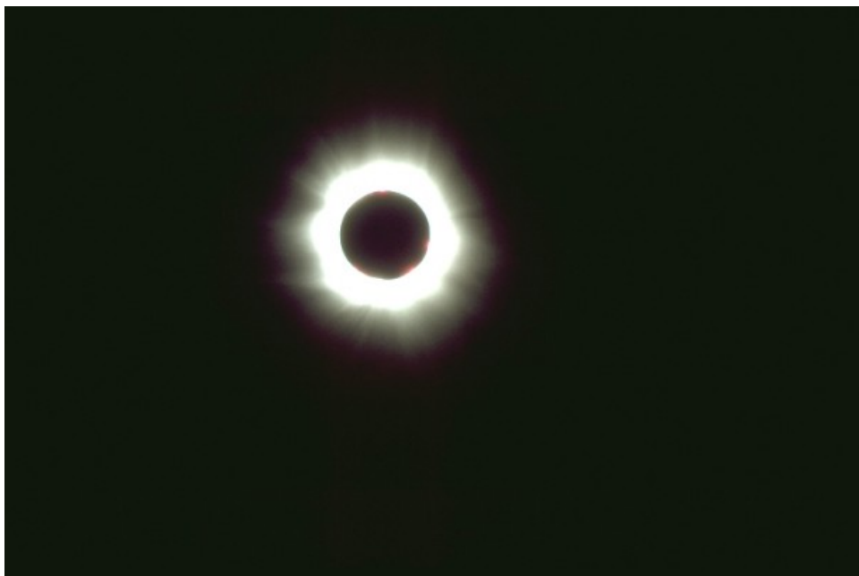
Eclissi Totale di Sole - 11/08/1999

Le immagini della totalità così digitalizzate sono state elaborate con Photoshop al fine di ottenere la seguente immagine con maggiore dinamica: