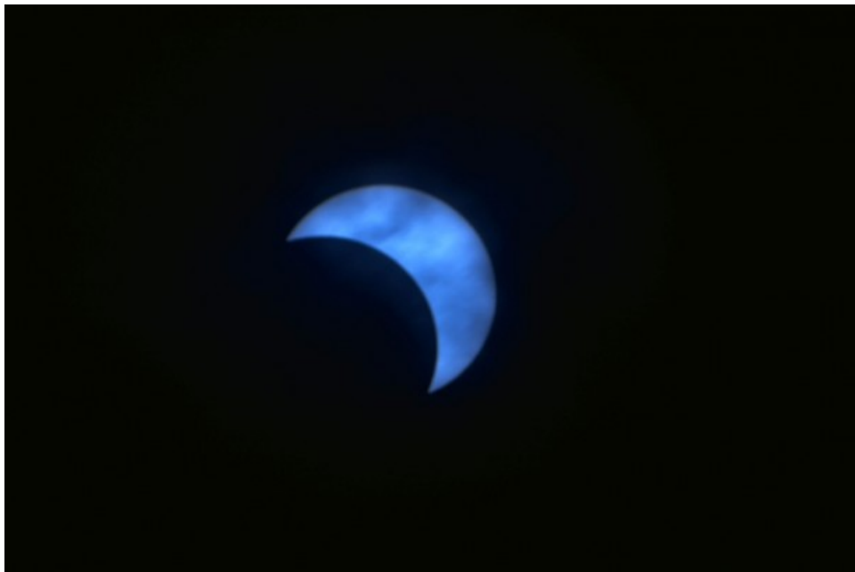
Eclissi Totale di Sole - 11/08/1999