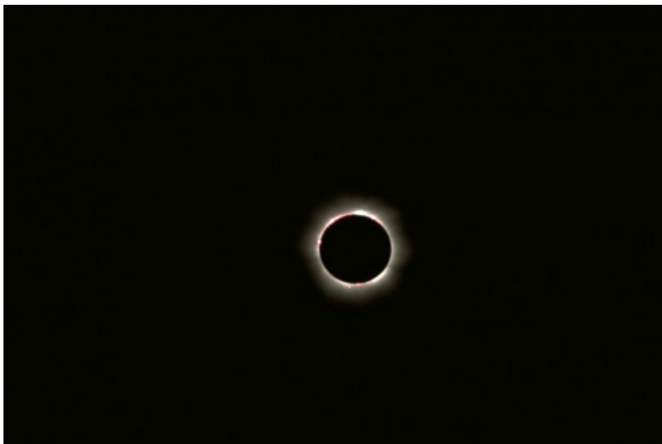
Eclissi Totale di Sole - 11/08/1999