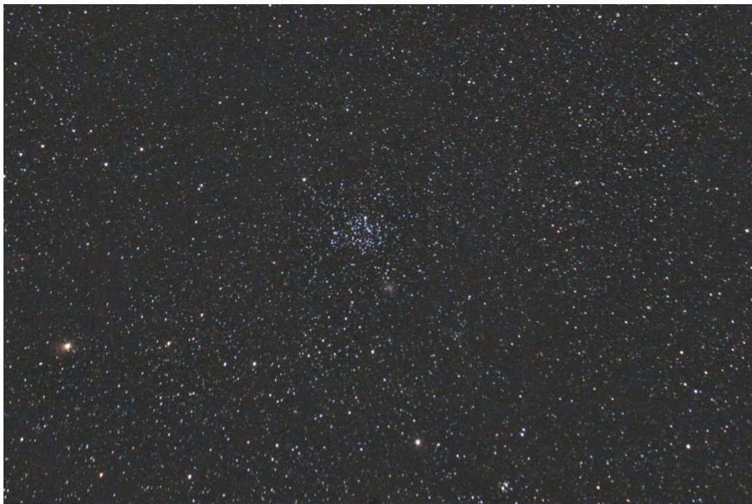
La regione di M35 - 31/03/2013

Riportiamo gli scarti, le prove ed altro riferiti al mese di Marzo 2013 (per maggiori informazioni cliccare qui ) .