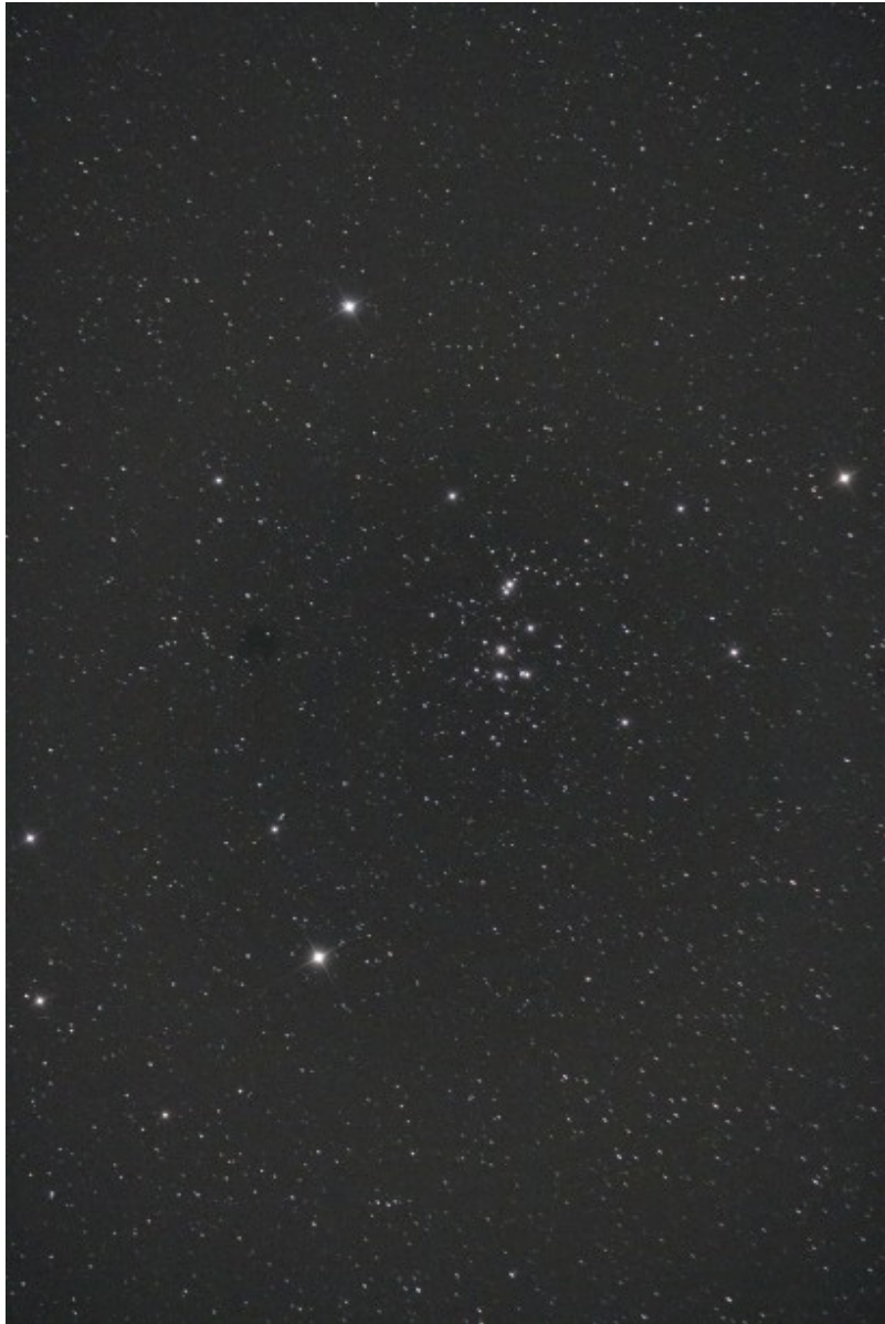
M44 - 31/03/2013