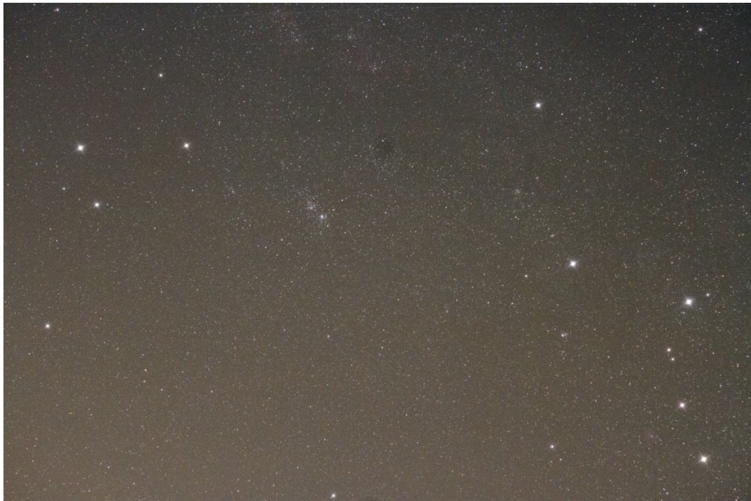
Regione del Doppio Ammasso del Perseo - 31/03/2013