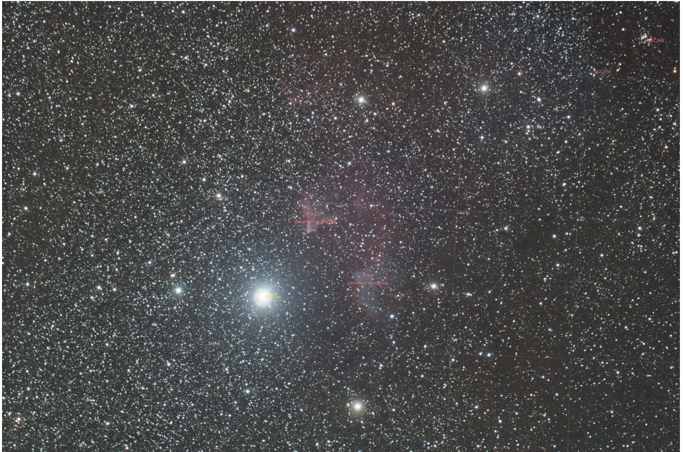
Sh2 185 (telescopio/telescope #2) mappa oggetti (DSO map). Visibili gli ammassi aperti NGC 358 and NGC 366 (open clusters NGC 358 and NGC 366 are shown) – 06/11/2021