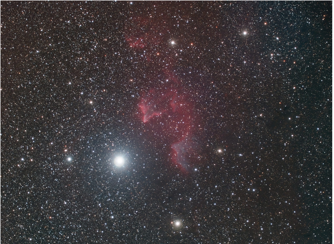
Sh2 185 (telescopio/telescope #1 and #2) composizione/composition (50%H \alpha +50%R)GB - 06/11/2021